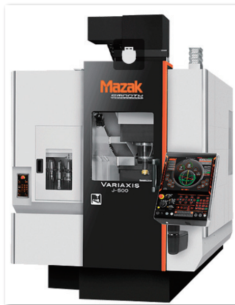
②5軸制御立形マシニングセンタ VARIAXIS j-500