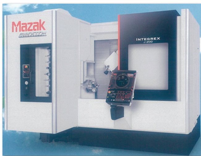
①複合加工機 INTEGREX j-200S 1000U